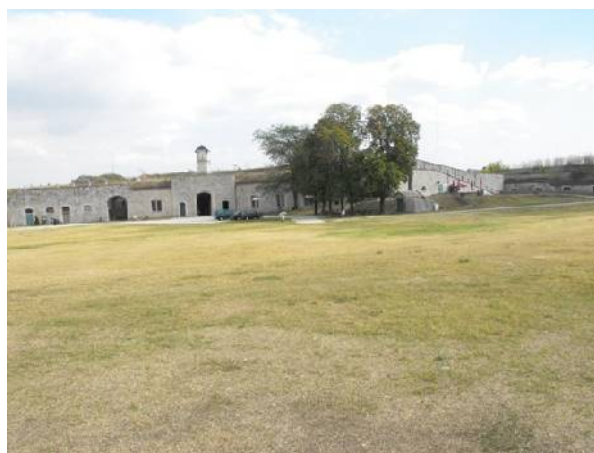
Monostori erőd – Bejárat a „Felvonulási tér” felől. Komárom.