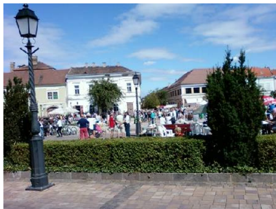
Váci lecsó fesztivál

Ez az út is várja, hogy a termést szolgálja.