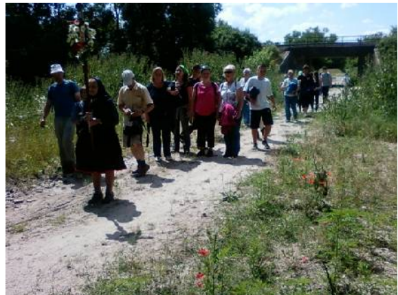
A „vissza út” kezdetén