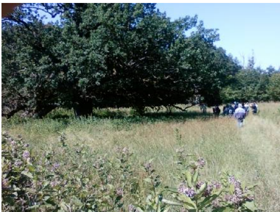
Pihenő az Öregfánál