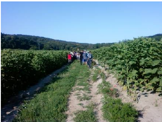
Útban a Nagyvölgy, Hajagvölgy déli oldalán

Az idén is megtartottuk községünk fogadott búcsúját, Sarlós boldogasszony ünnepét, a máriabesnyői kegytemplomban. A búcsújáró hívek 06:30-kor indultak a templom elől. Útközben a Szent András-, majd a Szentlászlói úton többen csatlakoztak a gyalogos zarándoklathoz.