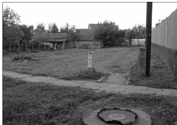
Malom utcai telek

Költségvetés módosítást fogadott el. Kötvény terhére kifizetett működésre felhasznált számlákat fogadott el. Ugyancsak elfogadta a 2008. évi zárszámadást. Értékesítésre elfogadta a Malom utcai, közelmúltban kialakított telkét