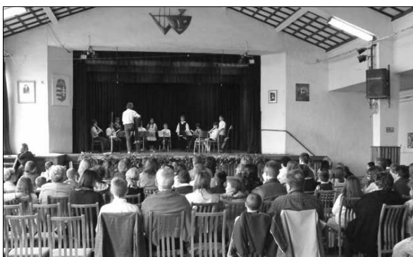
Galga-parti mesék