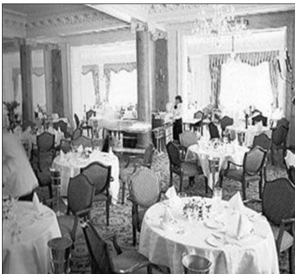
A hotel étterme

nyekhez hasonló törülközőket. Még a wc-tető is rózsafából volt! Baldahinos ágy ugyancsak rózsafa tartópillérekkel, hogy a többi bútortárat ne is részletezzem tovább. Másnap reggel az étteremben fehér kesztyűs úr toltá alám a fehér abrosszal, ezüsttel, porcelánnal terített asztal selyemdamaszt ülésű, valamilyen korabeli kecses széket. A pincérek ugyancsak fehér kesztyűben, fehér szmokingban, fekete csokornyakkendősen szolgálták fel az étlap bőséges választékából a kívánt villásreggelit.