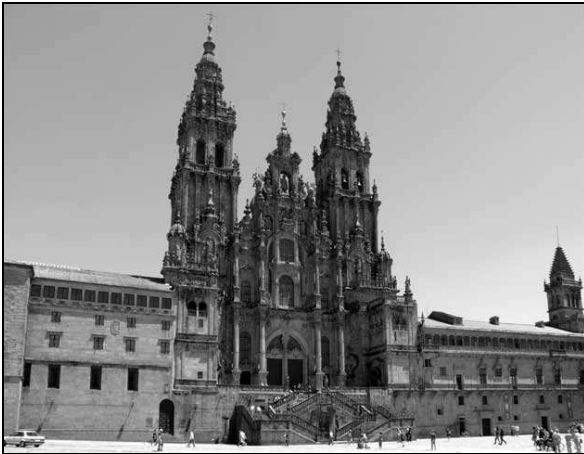
Santiago de Compostella

Az utolsó nap maga volt a csoda! Megint a véletlen (amely mögött, sőt nem is mögötte – ISTEN található), de amint a zarándokútlevelemet érvényesítettem és kijöttem az előtte lévő kisebb helységbe, hatalmas, hangos zaj vett körül. Igen! Az a tizenegy ember, akikkel az elmúlt hetek alatt fontosabb kapcsolatba kerültem, ott álltak kint. Gratuláltak nekem, kezet fogtunk és örültünk egymásnak. Pont ott voltak, pont akkor, és pont ők! Az út végén, ahol a zarándokoklevelet megkaptuk, találkoztunk!