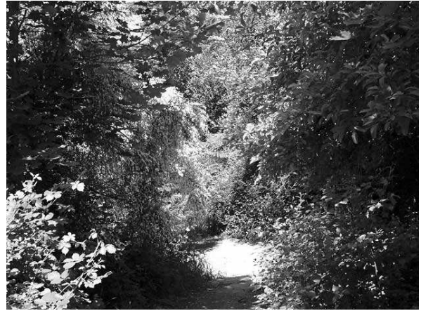
Borostyánnal benőtt út

Santiago de Compostella: Igen hallgattam egy napig, most meg már megérkeztem. Előző nap Arzua előtt indultam el, és délután Monte Gozóban szálltam meg. 38 kilométert tettem meg, és fel sem tűn. Jól éreztem magam, az út is erőt adott a látnivalókkal, levegővel, gondolatokkal.