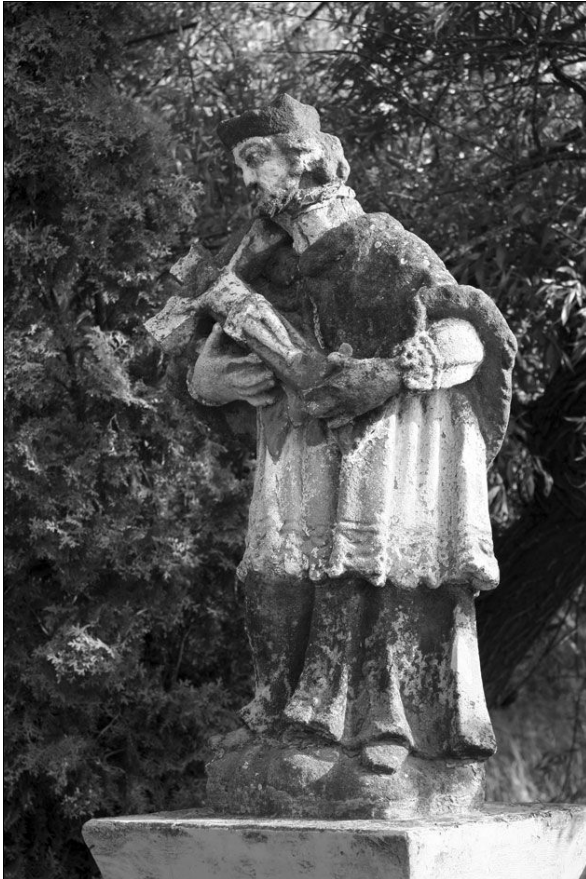
Nepomuki Szent János

érdeklődőket. A kiállítás mondani valóját a szerző alább olvasható írása fogalmazta meg, amelyet a 26 színes, 3 fekete-fehér kép hűen mutatott be.