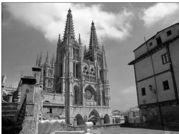
Burgos óriási katedrális

Ebéd után háromkor érkezünk a szállásra. Útközben lefényképezem a város óriási katedrálisát. (Ehhez képest elég kicsi a Párizsi Notre Dame!)